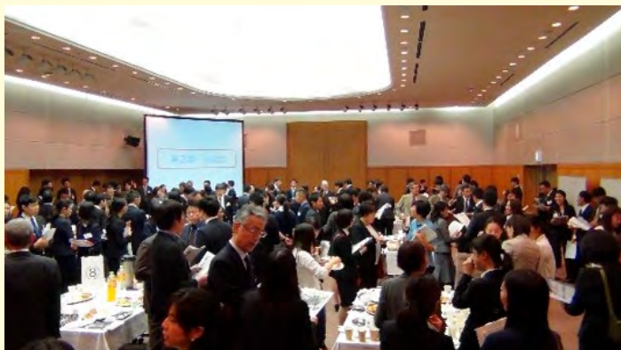
JICA 海外協力隊キャリアフェア「民間企業・団体向け帰国報告・交流会」 （令和2年2月19日）

当支部のブースには参加企業中最も多い29名の訪問があり、在日米軍従業員の雇用条件や待遇、職種等を説明し、各隊員のこれまでの経験を伺いながら現在募集している求人を紹介しました。英語資格要件、採用時期、異動に関する事など多くの質問も寄せられ、また、実際に応募を検討するとの声もあるなど、米軍基地の就職への高い関心がうかがえるものでした。