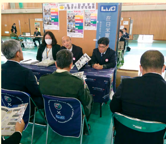
自衛隊神奈川地方協力本部主催 令和元年度就職援護フェア（令和2年2月14日）

また、自衛隊神奈川地方協力本部が主催する「令和元年度就職援護フェア」が2月13日（木）及び14日（金）に陸上自衛隊久里浜駐屯地で行われ、横須賀支部及び座間支部は14日（金）に参加しました。30の企業等がブースを開設し、令和2年度以降に定年予定の自衛官及び任期制自衛官約100名の隊員の参加がありました。