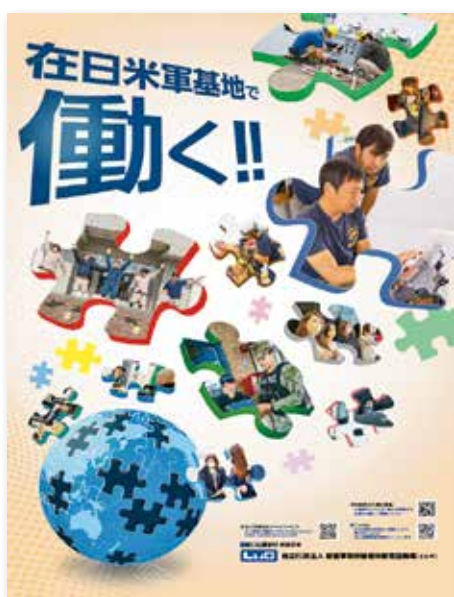
本州・九州の基地