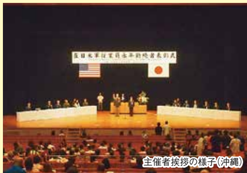
主催者挨拶の様子(沖縄)