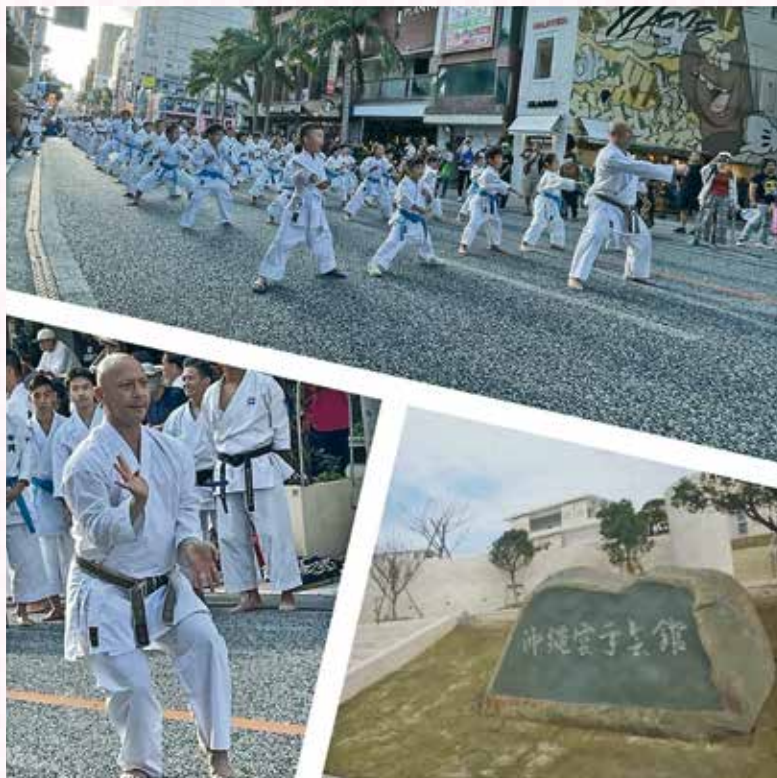
上段、下段左 令和5年10月29日(日) 空手の日記念演武祭 下段右 沖縄空手会館(豊見城市)

現在の「空手」という表記が正式に決まったのは1936年10月25日だそうです。この日にちなみ2005年3月、沖縄県議会において、10月25日を「空手の日」とすることが決議されました。「空手の日」には様々な催しが行われ、昨年10月においても那覇市国際通りに国内外からおよそ2,000人が集まり、一斉に演武を披露しました。その姿は圧巻で一見の価値があります。世界に広まった空手は、子供から大人まで楽しめる素晴らしいものです。皆様も沖縄へお越しの際は、空手の世界に触れてみてはいかがでしょうか。