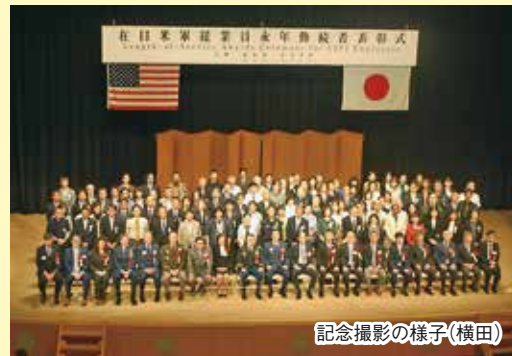
記念撮影の様子(横田)