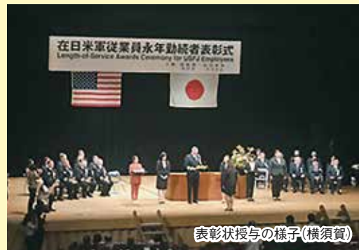
表彰状授与の様子(横須賀)