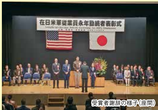
受賞者謝辞の様子(座間)